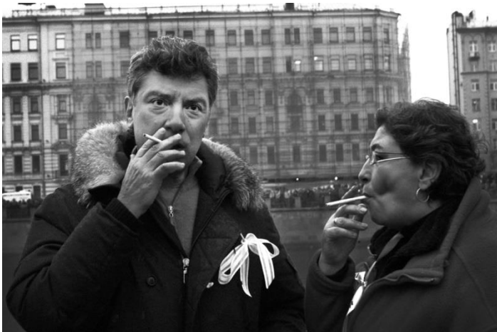
Boris Nemtsov, vermoord in 2015.

In maart 2018 heeft het platform een 'ongevraagd advies' gegeven aan minister Stef Blok van Buitenlandse Zaken, die kort daarvoor was aangetreden als opvolger van afgetreden bewindsman Halbe Zijlstra. In april heeft RaamopRusland, op uitnodiging van het ministerie, een presentatie gehouden voor een groep (hoge) ambtenaren van het departement. RaamopRusland is enkele malen uitgenodigd door de Commissie buitenlandse Zaken van de Tweede Kamer en individuele parlementariërs.