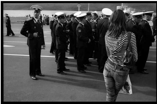
Kadetten in Astrachan.