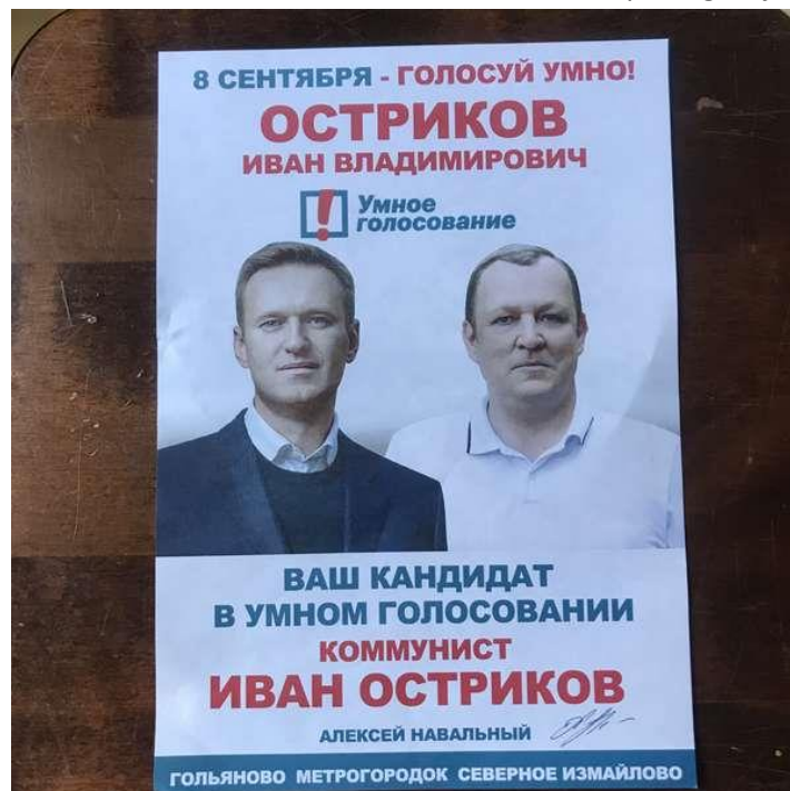
'Stem verstandig'. Een succesvolle actie van Navalny om Kremlinkandidaten uit gemeenteraad van Moskou te stemmen.

De resultaten van deze alliantie met de Universiteit Leiden worden puntsgewijs beschreven onder 4a.