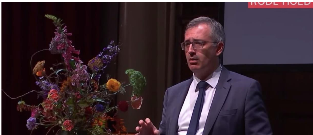
Sergei Guriev tijdens Oktober Lezing in De Rode Hoed.

Een deel van de artikelen op de website is in zijn oorspronkelijke Russische variant beschikbaar. In 2019 is de presentatie van deze Russischtalige publicaties substantieel verbeterd. Zie ook 5c.